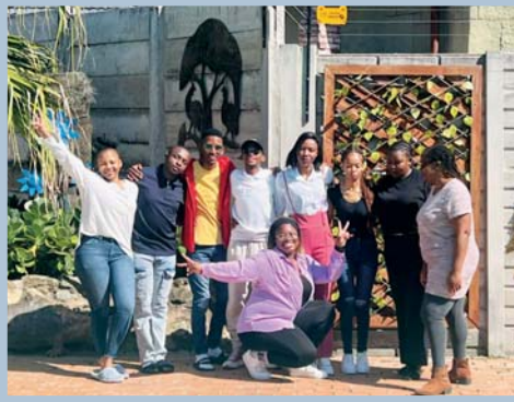
Freiwillige aus Botswana, Simbabwe und Südafrika beim Vorbereitungsseminar in Johannesburg

17 weltwärts-Freiwillige sind angekommen. Erste Eindrücke.