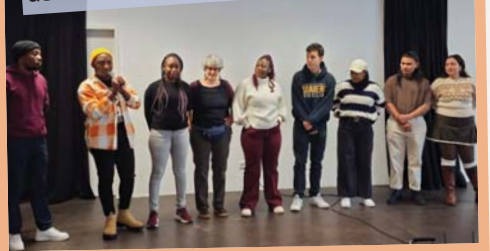
Ehemalige Freiwillige begrüßen die neuen Freiwilligen beim Willkommenscafé.