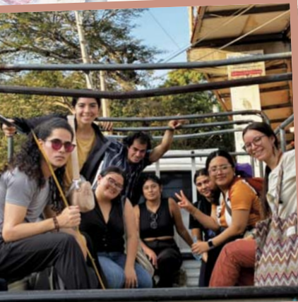
Freiwillige aus Nicaragua, El Salvador und Mexiko beim Vorbereitungsseminar in El Salvador