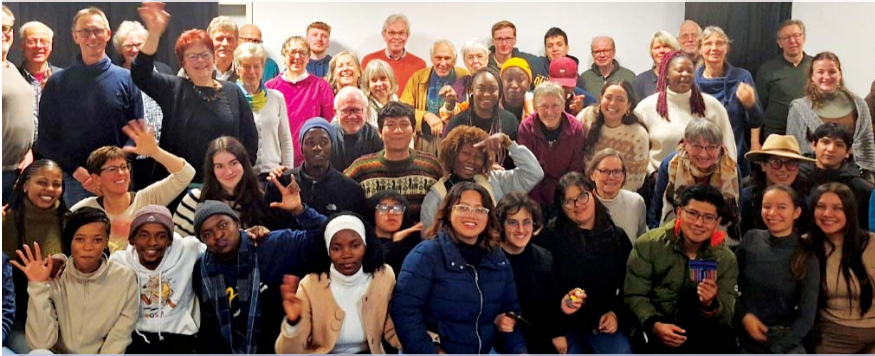
Beim Willkommenscafé der neuen Freiwilligen kommen viele Akteur*innen zusammen: Gasteltern, Freiwillige, ehemalige Freiwillige, Deutschlehrende, Mentor*innen, Pat*innen.