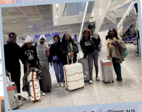
Ankunft in Deutschland – die Freiwilligen aus dem Südlchen Afrika am Flughafen Frankfurt