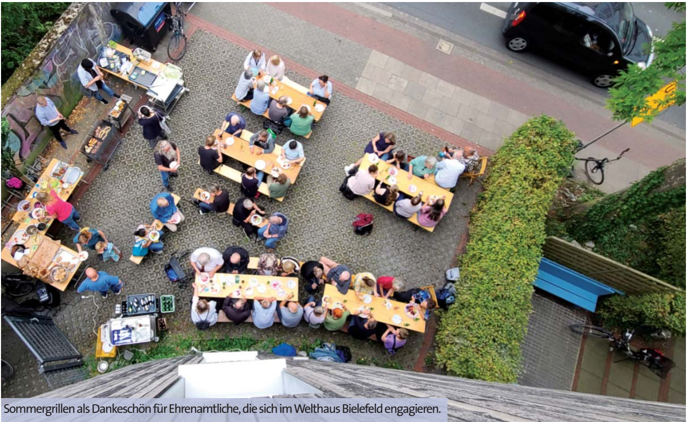
Sommergrillen als Dankeschön für Ehrenamtliche, die sich im Welthaus Bielefeld engagieren.