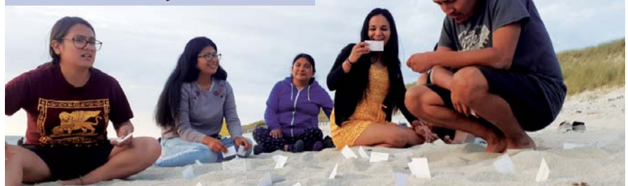
Süd-Nord-Freiwillige der Generation 2021/22 bei einem Seminar auf Sylt.