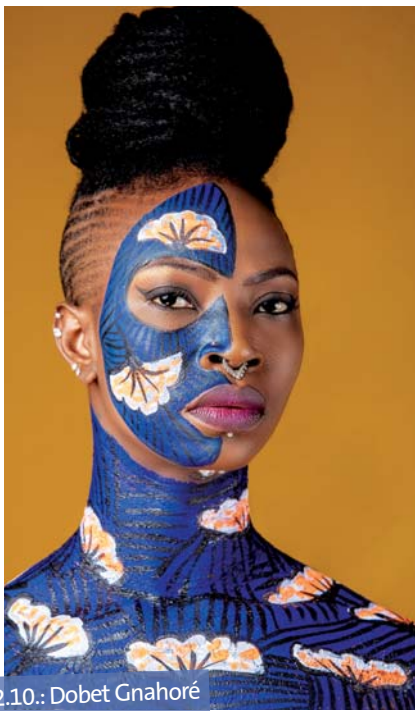
02.10.: Dobet Gnahoré

Das Weltnacht-Programm bietet im zweiten Halbjahr 2024 wunderbare Künstler*innen.