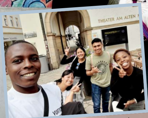
Aufgabe nicht gelöst: Das schadete der guten Laune bei der Stadt-Rallye aber nicht.