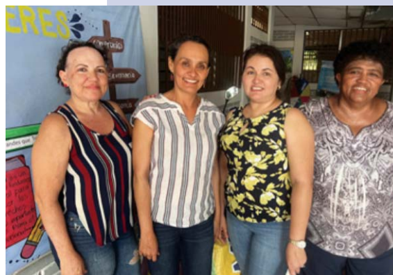
Das Team des Proyecto MIRIAM.

Förderung durch das Welthaus Bielefeld und die Laborschule Bielefeld. Spenden gern gesehen! www.welthaus.de/auslandsprojekte/nicaragua/frauenprojekt-miriam