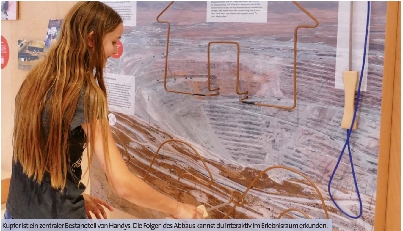
Kupfer ist ein zentraler Bestandteil von Handys. Die Folgen des Abbaus kannst du interaktiv im Erlebnisraum erkunden.