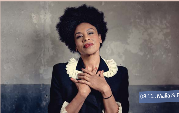
08.11.: Malia & Band

Das Welthaus Info erscheint vier Mal im Jahr. Freund*innen und Förder*innen erhalten es kostenfrei zugeschickt. Schutzgebühr: 2,50 Euro. Mit einer Spende ermöglichen Sie es, unseren Freund*innen weiterhin Einblicke in Themen von gesellschaftlichem Interesse zu geben. Danke schön für Ihren Beitrag!