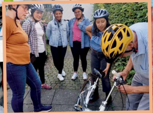
Deutschkurs im Welthaus Bielefeld. // Ohne passende Lenkerhöhe keine Radtour.