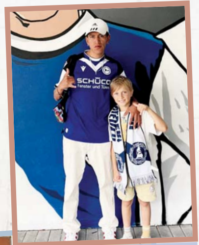
Mit Fan-Utensilien vor dem Stadion.

15 weltwärts-Freiwillige sind angekommen. Erste Eindrücke.