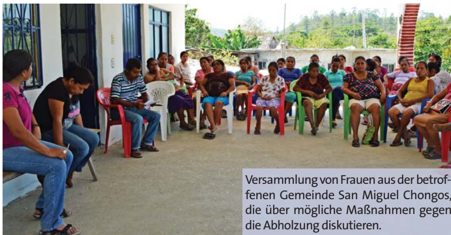
Versammlung von Frauen aus der betroffenen Gemeinde San Miguel Chongos, die über mögliche Maßnahmen gegen die Abholzung diskutieren.