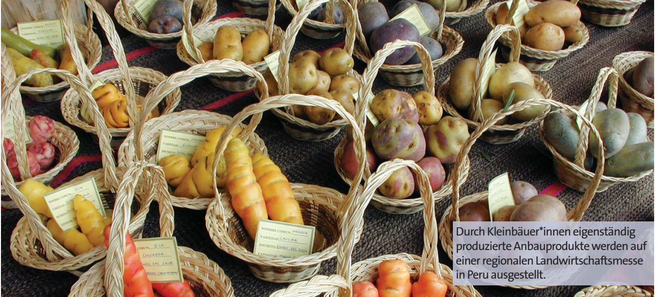
Durch Kleinbäuer*innen eigenständig produzierte Anbauprodukte werden auf einer regionalen Landwirtschaftsmesse in Peru ausgestellt.