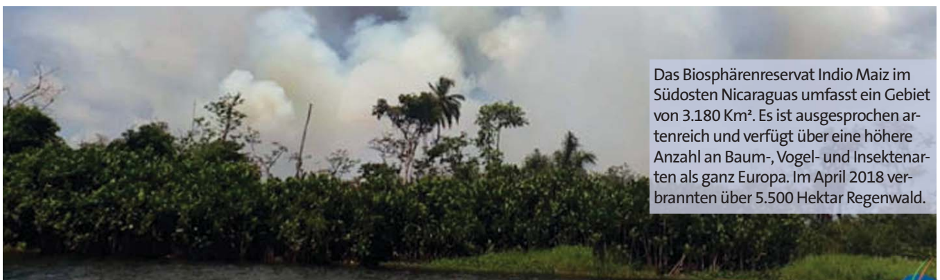
Das Biosphärenreservat Indio Maíz im Südosten Nicaraguas umfasst ein Gebiet von 3.180 Km 2 . Es ist ausgesprochen artenreich und verfügt über eine höhere Anzahl an Baum-, Vogel- und Insektenarten als ganz Europa. Im April 2018 verbrannten über 5.500 Hektar Regenwald.