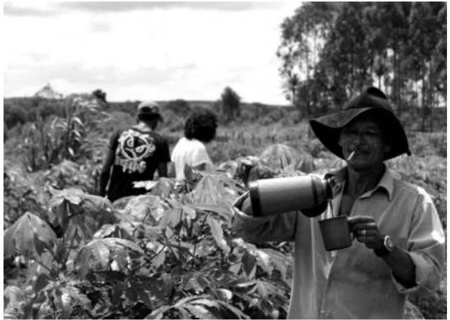
Landwirtschaft im Schatten des Eukalyptus: Kleinbauern der Landlosenbewegung besetzen und bepflanzen eine illegale Holzplantage.

..... ▲ Marianne Koch ist Mitarbeiterin des Welthaus Bielefeld im Bereich Auslandsprojekte.