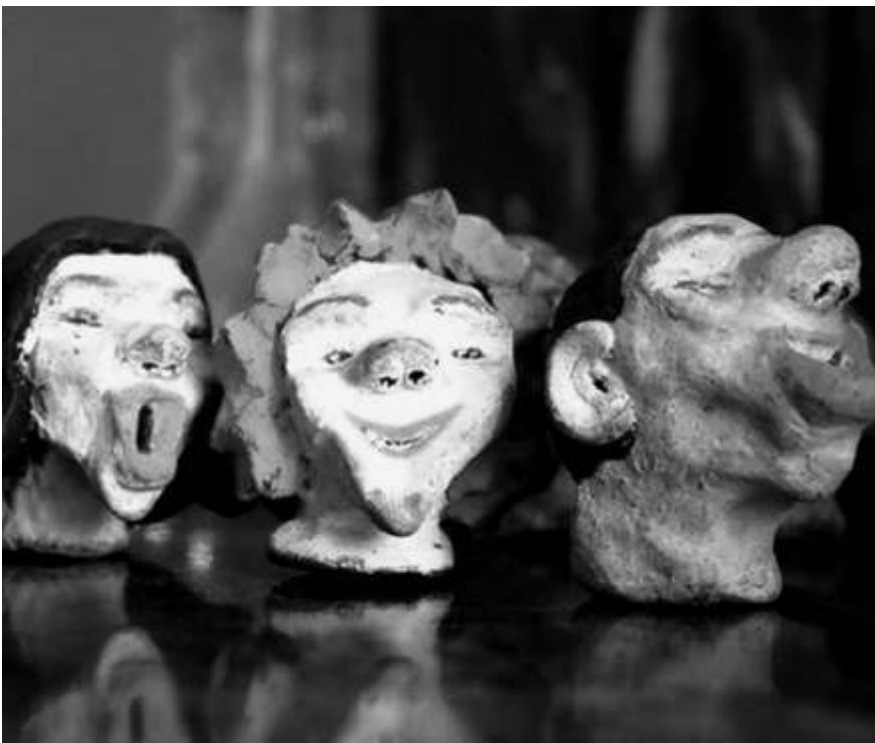
Glück hat viele mögliche Gesichter. Doch was gehört zum Glück? Das versuchen Wissenschaftler zu definieren.