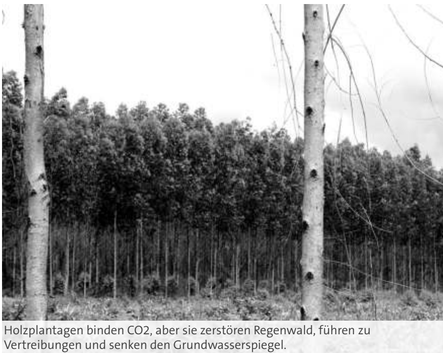
Holzplantagen binden CO 2 , aber sie zerstören Regenwald, führen zu Vertreibungen und senken den Grundwasserspiegel.