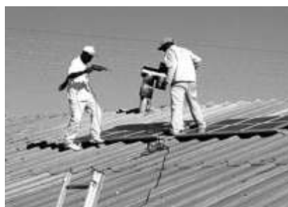
Zimbabwische Fachkräfte installieren die Module auf dem Dach der Schule.

Das Hilfswerk Brot für die Welt hatte sich seinerzeit eben dieser Nkululeko Schule angenommen und eine weiße Großfarm quasi „aufgekauft“. Das etwa 2500 Hektar große Gebiet im intensiven Landwirtschaftsgürtel wurde der Internatsschule zur Verfügung gestellt. Ein Projektbesuch von zwei Welthaus-Mitarbeitern 1981 konnte vor Ort erste Eindrücke von der neuen Schule sammeln.