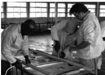
Die Solaranlage wird in der Halle der Schule zusammengeschaubt.

Martin-Niemöller-Schule und Nkululeko High School in Zimbabwe feiern 30-jährige Partnerschaft. Von Christoph Beninde