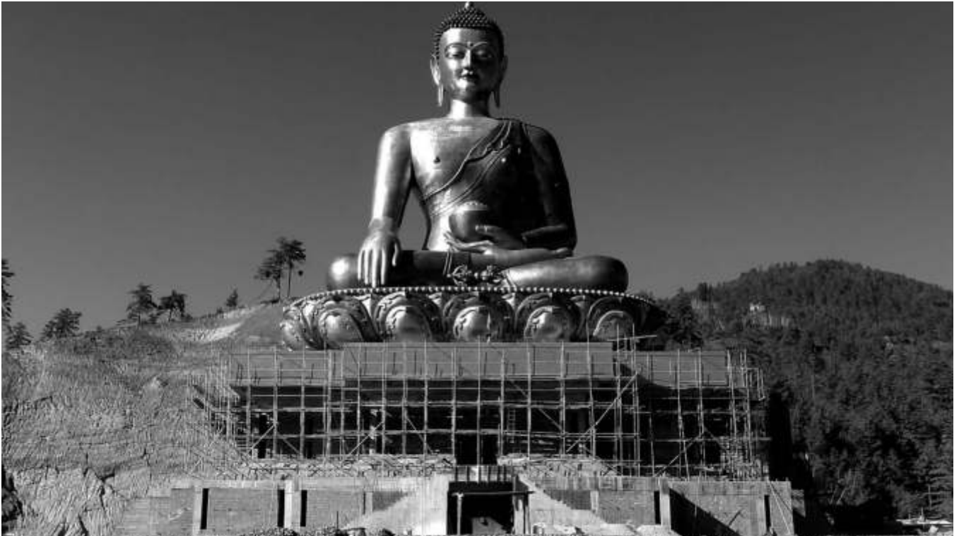
In den Bergen von Bhutan bauen die Menschen am Glück: Eine gigantische Buddha-Statue entsteht. Das von einem chinesischen Unternehmen finanzierte 100 Millionen Dollar-Projekt soll unter anderem Frieden und Glück auf die Welt bringen.

Bhutan, Ecuador und Bolivien wollen für ihre Menschen ein „gutes Leben“ erreichen. Gerecht und im Einklang mit der Natur. Von Uwe Pollmann