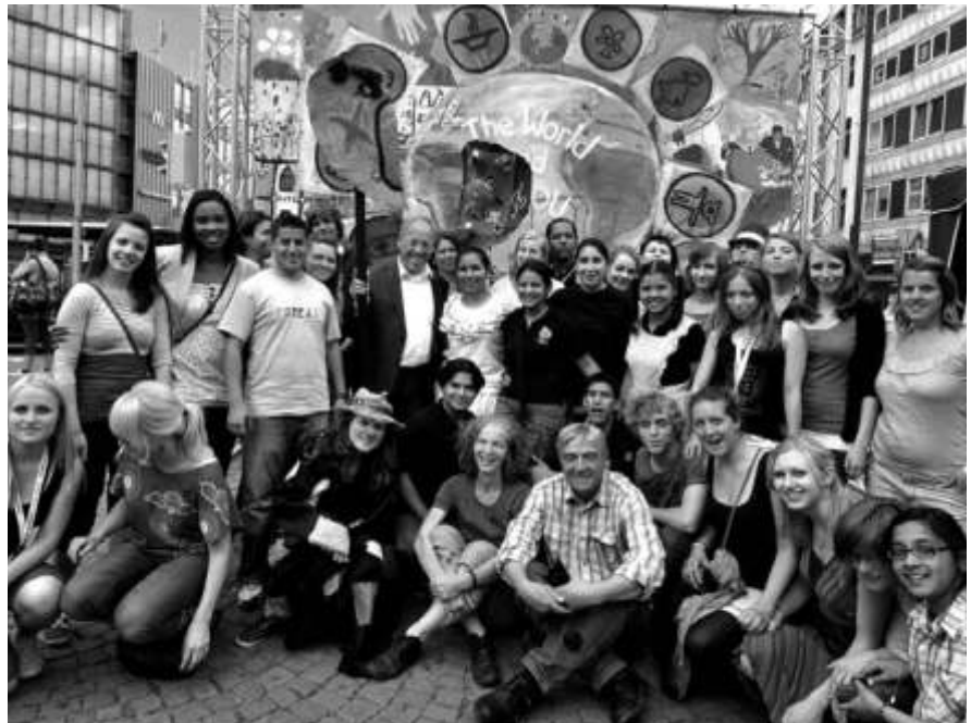
Gruppenbild der Jugendcamp-Teilnehmenden mit einem begeisterten Oberbürgermeister.

Die Armut bekämpfen, den Klimawandel stoppen, Gerechtigkeit schaffen: Jugendcamp war erfolgreich kreativ