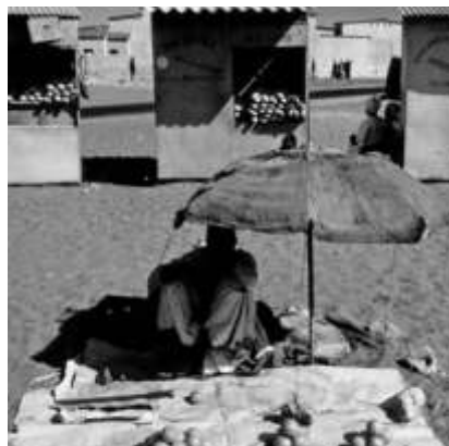
Kaum Angebot, keine Käufer: Markt in Dakar.

selbst zuvor noch Empfänger von Milliarden aus dem Marshallplan gewesen und wollte auch für andere was tun, andererseits war das neue Politikfeld ein Instrument der Diplomatie und Außenwirtschaftspolitik. Als 1961 Walter Scheel der erste Entwicklungshilfeminister wurde, glaubte man mit Wirt-