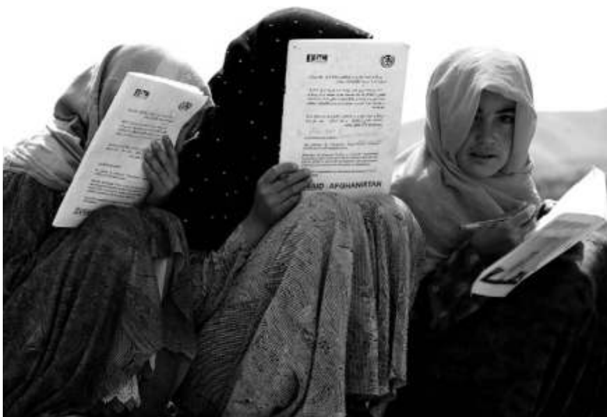
Das Thema „Gender“ kommt nicht vor. Dabei sind es vor allem Frauen, die eine große Rolle spielen, um eine friedliche Zukunft zu erreichen.

▲ VENRO ist der Verband Entwicklungspolitik deutscher Nichtregierungsorganisationen e.V., dem auch das Welthaus Bielefeld angehört.