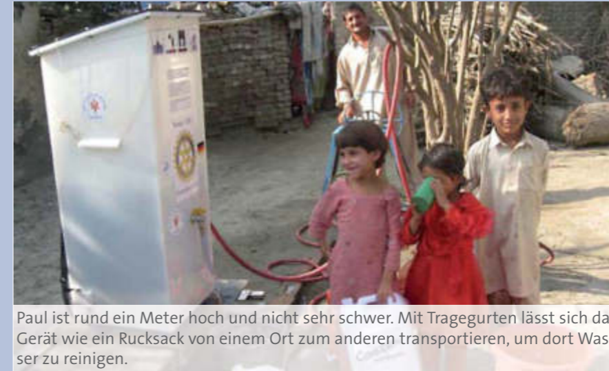
Paul ist rund ein Meter hoch und nicht sehr schwer. Mit Tragegurten lässt sich das Gerät wie ein Rucksack von einem Ort zum anderen transportieren, um dort Wasser zu reinigen.