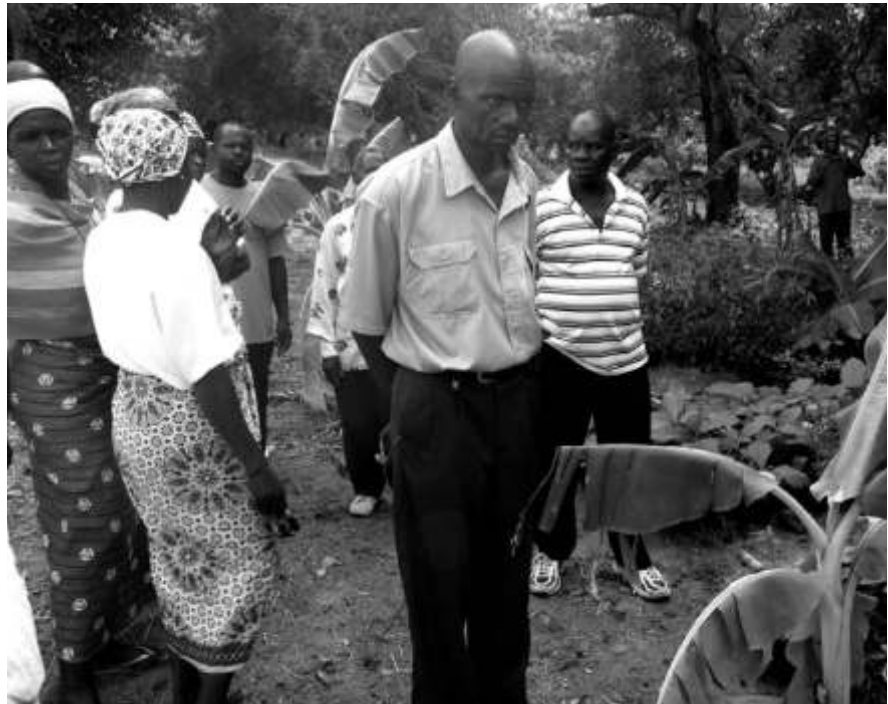
Mosambik: Neue Plantagen auf dem eigenen Land.