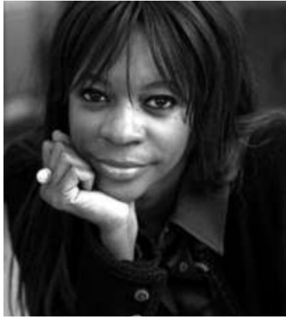
Eine der profiliertesten Kritikerinnen: Dambisa Moyo, die früher für die Weltbank arbeitete.

Dass Entwicklungspolitik teilweise den Falschen und auch den Zwecken der Geber dient als den Bedürfnissen der Nehmer, scheint unbestritten. Gerade konservative Regierungen machten aus