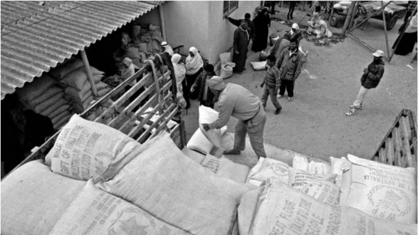
Die Hungerhilfe der Vereinten Nationen rettet vielen Menschen weltweit das Leben. Doch es gelingt nicht, die Hilfe überflüssig zu machen. Im Gegenteil: Trotz der verkündeten Millenniumziele nimmt der Hunger in der Welt zu.

Entwicklungshilfe half nicht immer den Armen, sondern diente politischen Strategien oder Eliten. Am Ende aber dient sie vielleicht uns allen. Von Uwe Pollmann