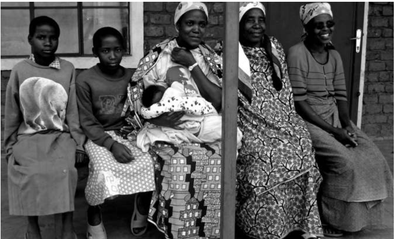
Eine Familie wartet auf Hilfe vor dem Gesundheitszentrum in Nyavyamo in Burundi.

Das Reha-Zentrum war deshalb wichtig, weil im Dorf viele kriegsversehrte ehemalige Guerilleros leben. Heute sind Kinder mit Behinderungen und deren Eltern die Hauptzielgruppe. Dank dieser Arbeit ist die Akzeptanz in der Bevölkerung gegenüber Menschen mit