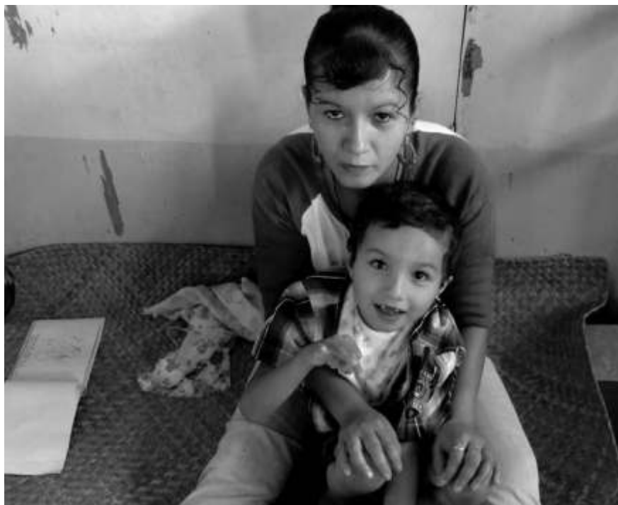
Guarjila: Erfolgreiche Integration von Behinderten in die Dorfgemeinschaft.