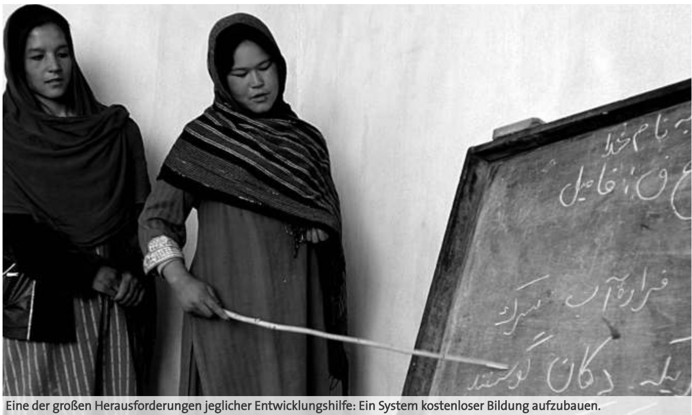
Eine der großen Herausforderungen jeglicher Entwicklungshilfe: Ein System kostenloser Bildung aufzubauen.

..... ▲ Uwe Pollmann ist Journalist und Welthaus-Info-Redakteur.