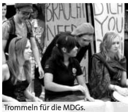
Trommeln für die MDGs.

Das Jugendcamp-Projekt wurde am 8. Dezember 2011 in Hannover im Rahmen des 5. Netzwerk21 Kongresses mit dem Deutschen lokalen Nachhaltigkeitspreis „Zeitzeichen“ in der Kategorie Internationale Partnerschaften prämiert. Mit diesem Preis wird beispielhaftes Engagement für eine lebenswerte Zukunft ins öffentliche Bewusstsein gerückt.