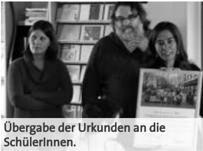
Übergabe der Urkunden an die SchülerInnen.

Bei der Übergabe der Kunstwerke im Welthaus ergab sich noch die Chance zu einem Gespräch. Klar wurde, hier steht nicht nur ein Künstler oder eine Künstlerin mit Namen unter dem Gemälde, sondern es war jeweils ein Gruppenprozess mit vielen Debatten. Die Schüler lernten, dass sich die Lebensbedingungen der Menschen in anderen Klimazonen stark von unseren unterscheiden. So fiel die Bemerkung, „die Inuit essen die rohe Leber der Robbe“ gleich dreimal. Überhaupt sei die Robbe sehr wichtig für die Inuit, weil sie das Fleisch, das Fell und die Knochen der Tiere als Nahrung, Kleidung und für Werkzeuge nutzen.