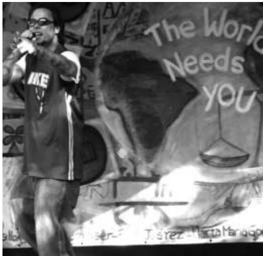
Rapper DBLuDee sorgte bei der Eröffnungsfeier mit seinem Song „Stand Up Take Action“ für Stimmung.

25 Kilometer umfasst Deutschlands erster Millenniumsradweg in Bielefeld. Eine Bilderreise von Wiebke Langreder