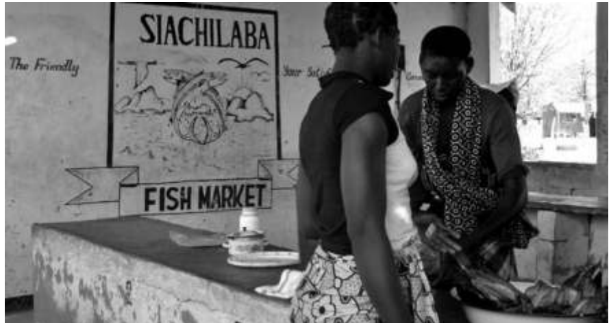
Zimbabwe: Fischmarkt am Ufer des Sambesi.

Die Frauen der Tonga leiden besonders unter der Situation. Sie sind kulturell stark benachteiligt und haben nun schon seit Jahrzehnten nicht mehr die Möglichkeit, die traditionell den Frauen vorbehaltene Art des Fischfangs mit den ZUBO-Körben auszuüben. Das ist nicht nur ein ökonomischer, sondern auch ein sozialer Verlust. Der Fischfang