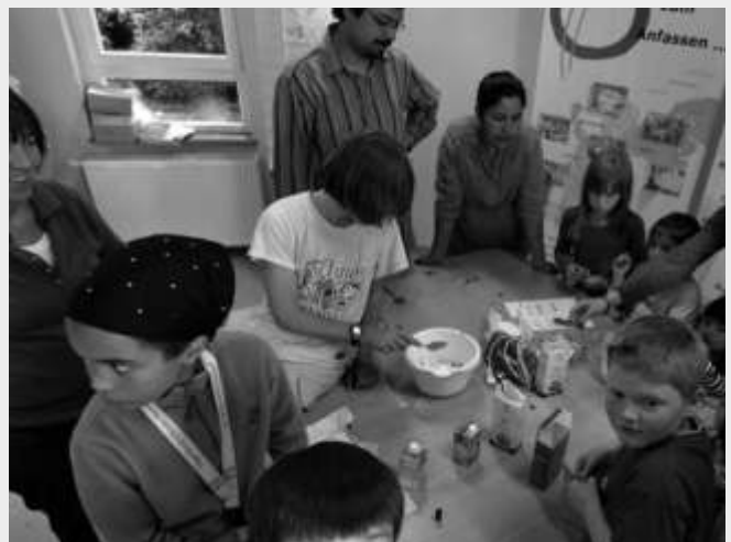
Die Schokoladenwerkstatt am Tag der offenen Tür zog viele süße Kinder an.