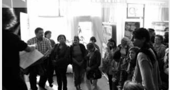
Viele BesucherInnen nutzten den Tag der Offenen Tür, um am kolonialgeschichtlichen Stadtrundgang teilzunehmen.