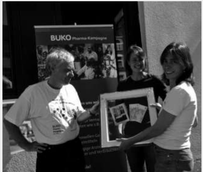
Die Buko-Pharmakampagne gratuliert dem Welthaus zum Jubiläum am Tag der Offenen Tür.