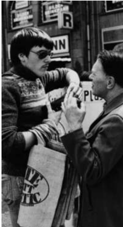
Mit politischen Aktionen wie hier zur Jutetasche 1978 leistete die GEPA Pionierarbeit für den Fairen Handel.