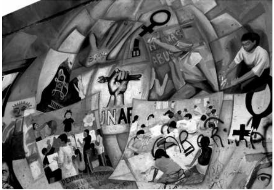
Wandmalerei im Funarte Bildungsprojekt in Nicaragua,

Und natürlich hat die Kürzung auch Folgen für unsere Partner: nicht alle etablierten Projektplätze können wieder besetzt werden. Das ist schade für Partner, die versucht haben die Integration der Freiwilligen zu verbessern und über zwei oder drei Jahre hinweg Strukturen dafür aufzubauen. Auch wird es kaum noch möglich sein, die Projekte durch zusätzliche Begleitmaßnahmen zu unterstüt-