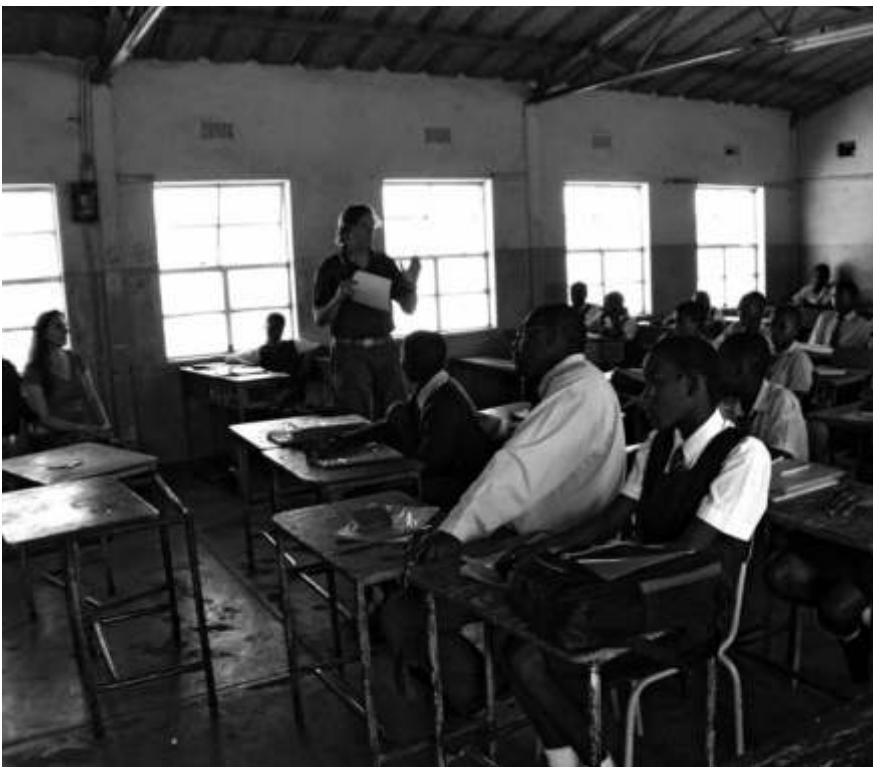
Ein Bielefelder Gastdozent unterrichtete in Zimbabwes Nkululeko Highschool.

Wir haben sowohl in der Stadt als auch auf dem Land immer wieder gefragt, wie die Zimbabwer ihre Zukunft sehen und was sie sich wünschen. Einhellig war die vorherrschende Meinung, wir wollen nächstes Jahr keine Wahlen. Die GNU (Government of National Unity) soll weiterarbeiten, die ersten Fortschritte langsam ausbauen und uns in Ruhe leben lassen. Man ist erleichtert über dieses Jahr der relativen Normalität, in dem man sich darauf konzentrieren kann, sein Zuhause zu entwickeln, die Kinder in die Schule zu schicken und die Ernährung zu sichern. Auf dem Lande herrscht regelrecht Angst vor den nächsten Wahlen. Viele befürchten, dass der vorsichtige Aufschwung zum Stillstand kommt.