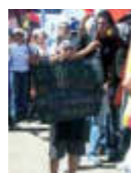
Das Titelbild zeigt den Stand-Up Action Day 2010 in der Partnerstadt Estelí in Nicaragua.