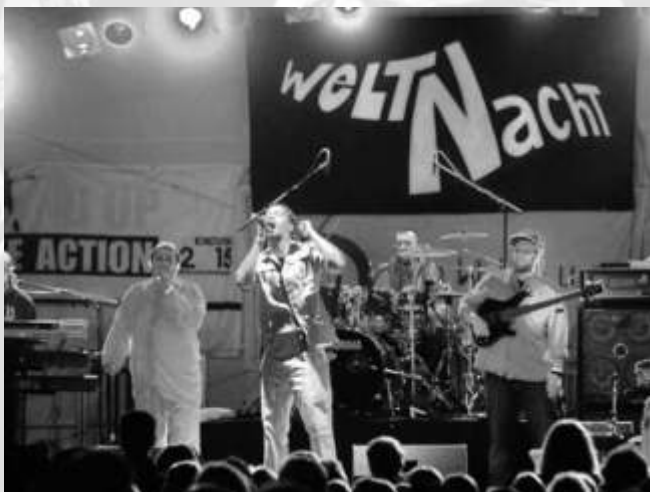
Dub Incorporation traten am 4. September 2010 beim Weltnacht Open-Air im Raspi-Park auf.

2010 – das Jubiläumsjahr des Welthaus , geht seinem Ende entgegen. Ein paar der Highlights des übers ganze Jahr gestreuten Festlichkeiten haben wir hier optisch festgehalten: Akrobatik, Musik, Schokolade, viel Sonne, Kuchen, Glückwünsche und einen Stadtrundgang mit kolonialgeschichtlichen Hintergründen gab es am Tag der Offenen Tür Anfang September; beim Rathausempfang am 6. November begrüßte uns nicht nur Jutta Küster, Moderatorin bei Radio Bielefeld, sondern auch die Salsaband Samba Rua Viva im Ratssaal. Ein abwechslungsreiches buntes Programm im ansonsten eher ernsten Rathaus folgte. Zum Jubiläum gehörte auch der Stand-Up Action Day im September und die Weltnachtkonzerte, unter anderem im Raspi-Park stattfinden. Vieles mehr passierte, und bleibt den Mitarbeitenden, Freunden und Besuchern des Welthaus Bielefeld in angenehmer Erinnerung.