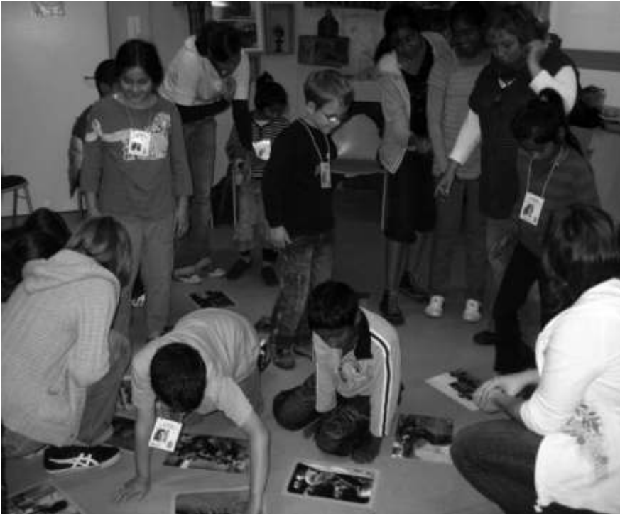
Der Schokolade-Aktionstag bringt Leben in die Stadtbibliothek.