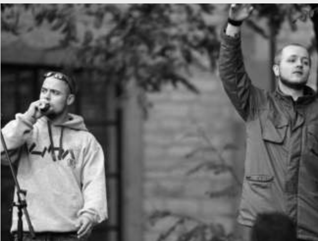
Cool: Die Rapper von DBLuDee sorgten beim Stand-Up-Action Day am 18. September für die richtige Hüpf-Stimmung.