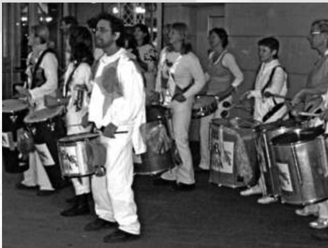
Sambab Ruda Vida spielten zur Begrüßung beim Jubiläums-Empfang im Rathaus am 6. November 2010.