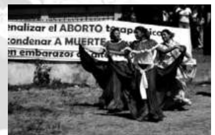
Drei Teilnehmerinnen eines Tanzkurses von MIRIAM. Im Hintergrund ein Banner gegen die Illegalisierung von Schwangerschaftsabbrüchen

Wie schon gesagt, habe ich persönlich sehr von dieser Zeit in positivem Sinne profitiert, im Gegenzug haben aber auch meine Kolleginnen und Freunde von mir andere Ansätze, ein Problem zu lösen oder die Arbeit mit anderen Organisationen zu koordinieren, kennen gelernt. Oft sagten sie mir, manchmal auch mit einem Augenzwinkern: