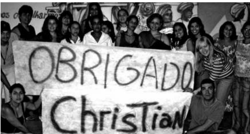
Mitarbeiter des CAMM-Projektes sagen "Danke", nachdem sie vom Tod erfuhren.