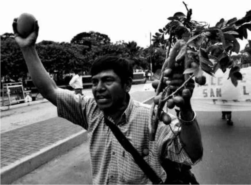
Filmausschnitt aus Tambogrande

Sonntag, 25. November 2007, 11 Uhr im Welthaus: Film: Tambogrande – Mangos, Murder, Mining ... Ein international beispielhaft erfolgreicher Fall von Protestbewegung verhinderte 2002 den geplanten Goldbergbau im Tambogrande, wie er von dem kanadischen Konzern Manhattan Minerals geplant war. Internationale Proteste und eine Abstimmung von 98% in Tambogrande selbst beendeten das Vorhaben.