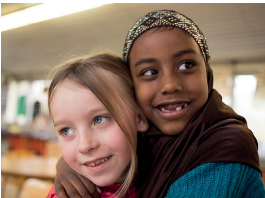
In der Laborschule wird Antirassismus gelebt.

2.500 Schulen tragen das Siegel »Schule ohne Rassismus«. Aber was heißt das? Über Wege zum rassismusärmeren Zusammenleben an der Laborschule Bielefeld berichtet Julia Westphal .