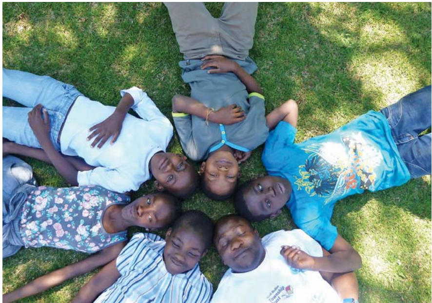
Kinder in Sophiatown aus der Sicht von Ricarde Thate (weltwärts-Freiwillige).

Als gebildete junge Deutsche, die sich dem Ideal einer gerechten Welt verbunden fühlt, könntest du denken, dass die koloniale Vergangenheit nichts mit dir zu tun hat. Wie auch der Holocaust mag sie vielleicht schwer auf den Schultern deiner Großeltern und Eltern lasten, aber du, so wie meine jungen Töchter »frei geboren« (eine südafrikanische Bezeichnung zur Benennung der Kinder, die nach dem 27. April 1994 geboren wurden, als Südafrika sich selbst zu einer freien, demokratischen und »rassen«freien Gesellschaft erklärt hat), bist unbeschwert von all dem Horror des Rassismus in der Geschichte. Du kommst in unser Land mit aller Offenheit