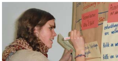
Rückkehrer*innen übernehmen die Vorbereitung der neuen Freiwilligen.

Hier gibt es einen Unterschied: diese Freiwilligen sind etwas älter und haben bereits professionell in Partnerorganisationen gearbeitet – als Erzieher*innen oder Sozialarbeiter*innen oder Umweltingenieur*innen.