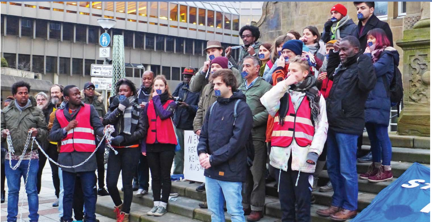
Rassismus hat viele Facetten: Die Demonstration am 22. Dezember 2017 vor dem Bielefelder Rathaus wandte sich gegen Menschenhandel.