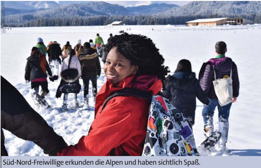
Süd-Nord-Freiwillige erkunden die Alpen und haben sichtlich Spaß.

Seit zehn Jahren gibt es »weltwärts«: Mit dem Programm können junge Leute ein Jahr in einem Projekt im globalen Süden arbeiten. Das Welthaus ist von Anfang an dabei. Ein Bilanz von Barbara Schütz .