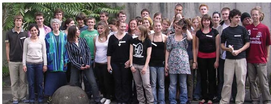
Die ersten ausreisenden Freiwilligen beim Ausreisefest 2008.

Das »weltwärts«-Programm bedeutet aber auch: Es wird viel geflogen. Neben den Freiwilligen fliegen Eltern, Freund*innen,