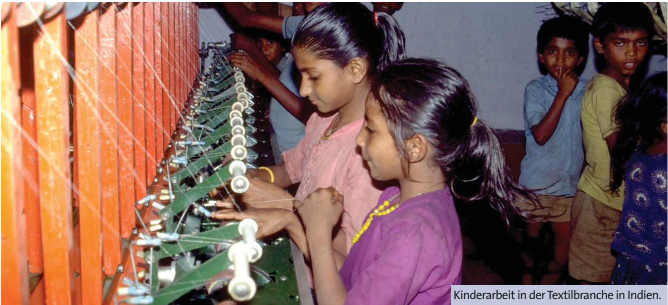
Kinderarbeit in der Textilbranche in Indien.