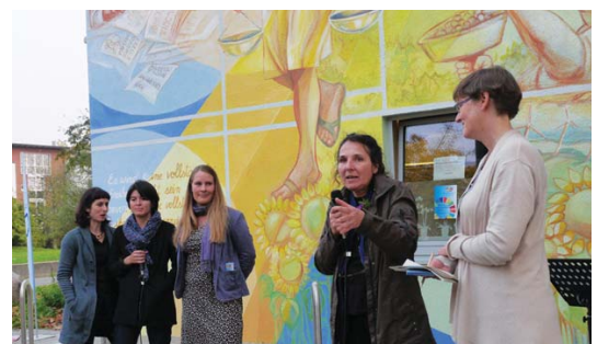
Am 17. Oktober fand das Abschlussfest am Jugendgästehaus statt.