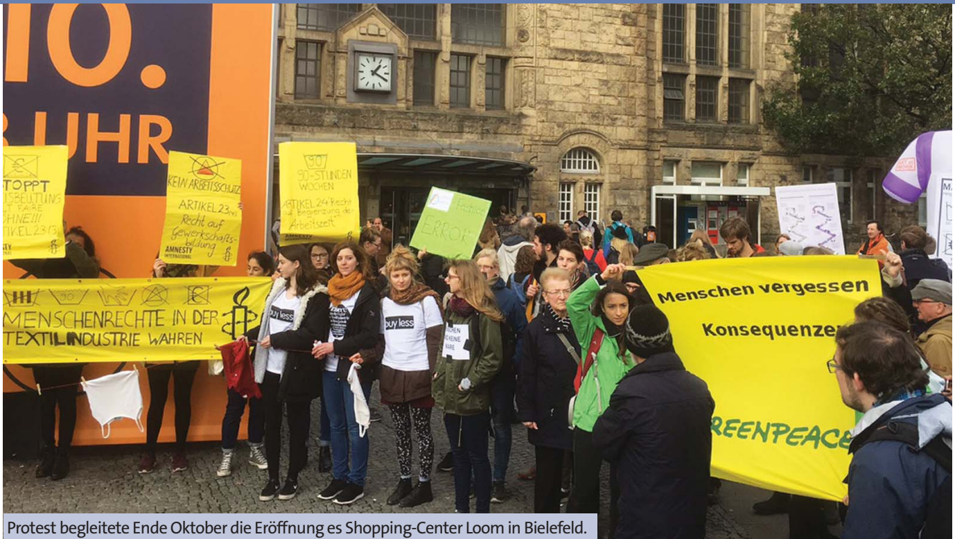
Protest begleitete Ende Oktober die Eröffnung des Shopping-Center Loom in Bielefeld.