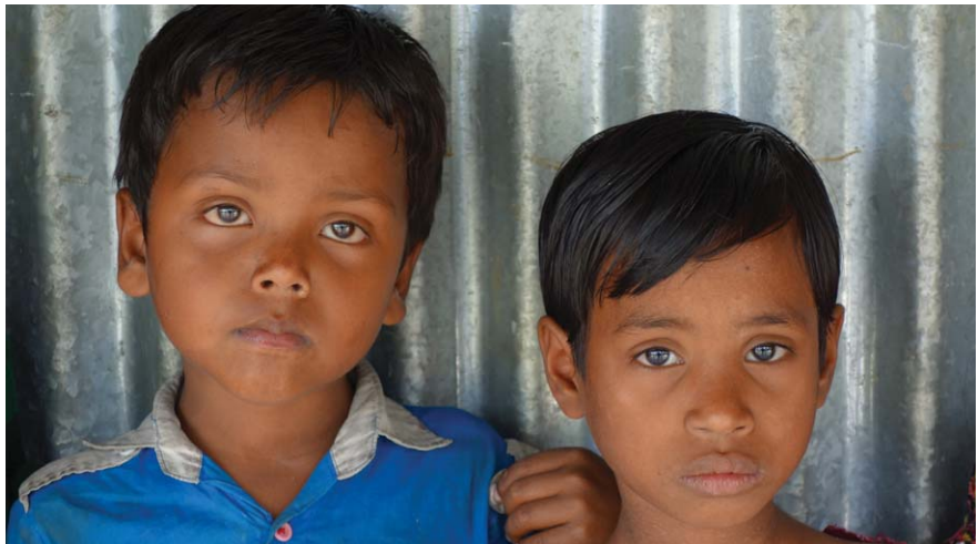
Eltern von Kindern in armen Ländern, wie diese beiden in Bangladesh, haben kaum Geld. Traditionelle Lebensmittel sind out. Dieses wird zunehmen für Süßes, Fettiges und Kalorienreiches ausgegeben. Früh droht Übergewicht und Zuckerkrankheit.

Doch eine einseitige Ernährung ohne viel Vitamine, Ballaststoffe oder Minerale