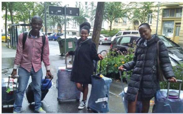
Die ersten Süd-Nord-Freiwilligen treffen ein. Die Koffer sind durch Plastikfolien gut gegen den Regen geschützt.