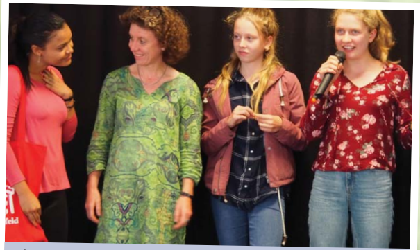
Mit einem Willkommens-Kaffee werden die Freiwilligen, Gastfamilien und Mentor*innen offiziell begrüßt.