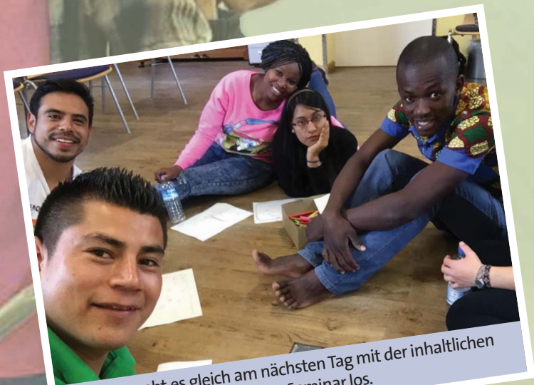
Und dann geht es gleich am nächsten Tag mit der inhaltlichen Vorbereitung im gemeinsamen Seminar los.