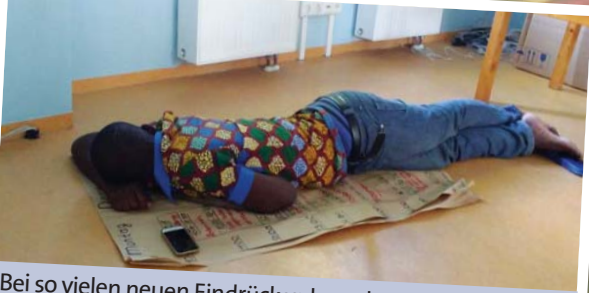
Bei so vielen neuen Eindrücken braucht es da zwischendurch ein Nickerchen.