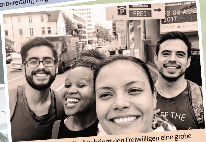
Wo ist was? Die Stadtralley bringt den Freiwilligen eine grobe Orientierung und viel Spaß.