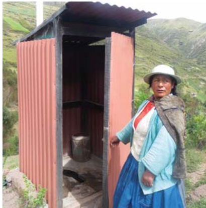
Im ADECAP-Gesundheitsprojekt gibt es neue Toiletten.

In Peru ist ein Projekt zur Verbesserung der Gesundheitssituation angelaufen. Von Kristina Baumkamp