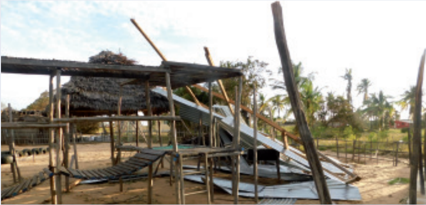
Die zerstörte Schule wird gerade wieder aufgebaut.

Am 15. Februar zog ein Wirbelsturm mit Windgeschwindigkeiten von über 160 Stundenkilometer über Mosambik hinweg. Die Escolhina Nhassanana, eine Partnerorganisation des Welthauses, in der zwei weltwärts-Freiwillige tätig sind, ist von den Auswirkungen stark betroffen. Es wurden etliche Dächer und Schilfrohrwände fortgerissen und viele Materialien wurden zerstört. Personen kamen glücklicherweise nicht zu Schaden.