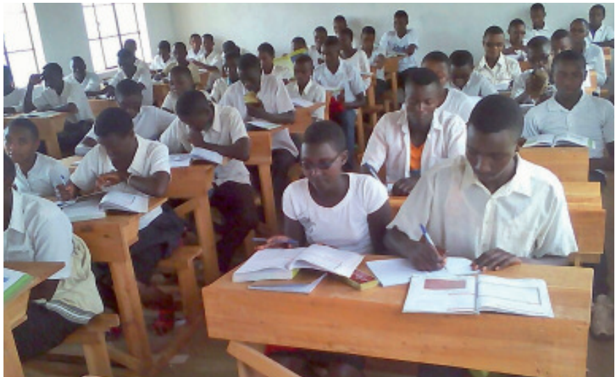
Ein großer Fortschritt: die Klassenzimmer sind eingerichtet und in Betrieb.

In den folgenden Tagen fanden Besuche in den unterschiedlichen Jahrgangsstufen und längere Gespräche mit SchülerInnen und LehrerInnen statt. An einem der letzten Tage folgte noch ein schönes Treffen mit vielen Mitarbeitern der CEPBU und deren Familien. In den gut drei Wochen meiner Anwesenheit konnte ich mich überzeugen, wie gut das Projekt durchgeführt worden war und wie es die Bildung und damit Zukunftschancen der Kinder von Nyavyamo verbessert werden.«