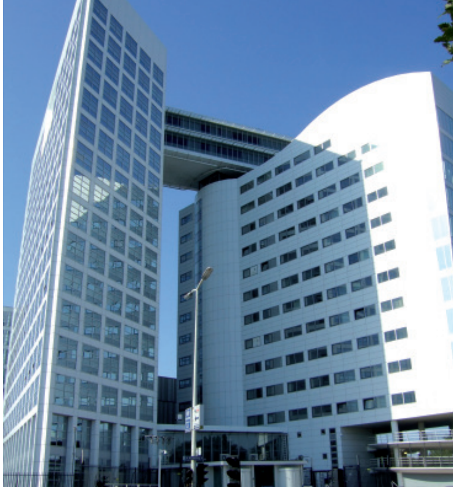
Eine ganze Reihe von Staaten kooperiert nicht mit dem Internationalen Strafgerichtshof.

Für die Förderung dieses Heftes danken wir Brot für die Welt, Inlandsförderung.