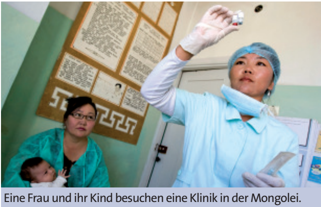
Eine Frau und ihr Kind besuchen eine Klinik in der Mongolei.

Die BUKO-Pharmakampagne kritisiert, dass die Weltgesundheitsorganisation die Bill & Melinda Gates Stiftung in ihr Verwaltungsgremium aufnehmen will