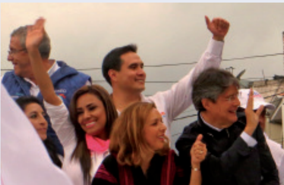
Präsidentenwahlkandidat Guillermo Lasso (vorne rechts) beim Wahlkampf in Loja.