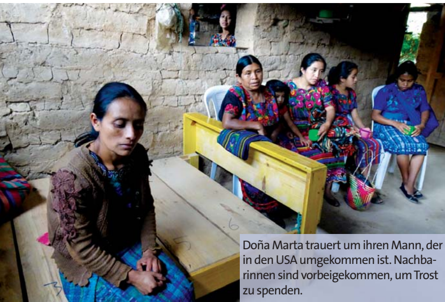
Doña Marta trauert um ihren Mann, der in den USA umgekommen ist. Nachbarinnen sind vorbeigekommen, um Trost zu spenden.

Andreas Boueke lebt und arbeitet als Journalist in Guatemala, er ist ehrenamtlicher Mitarbeiter des Welthaus Bielefeld.