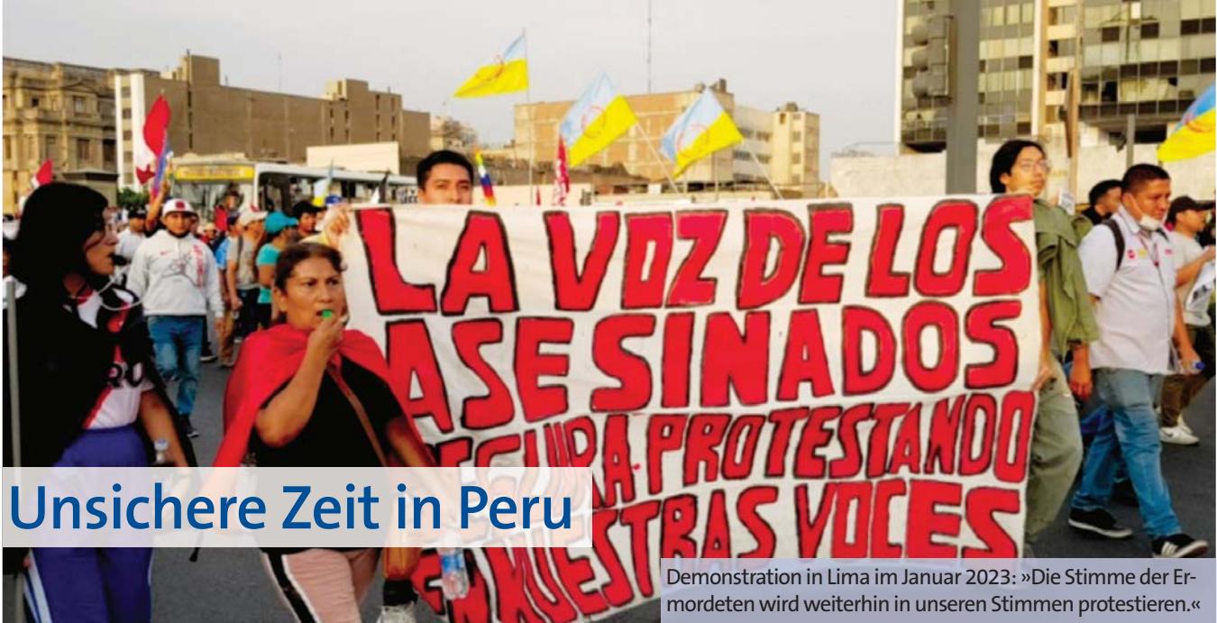
Demonstration in Lima im Januar 2023: »Die Stimme der Ermordeten wird weiterhin in unseren Stimmen protestieren.«