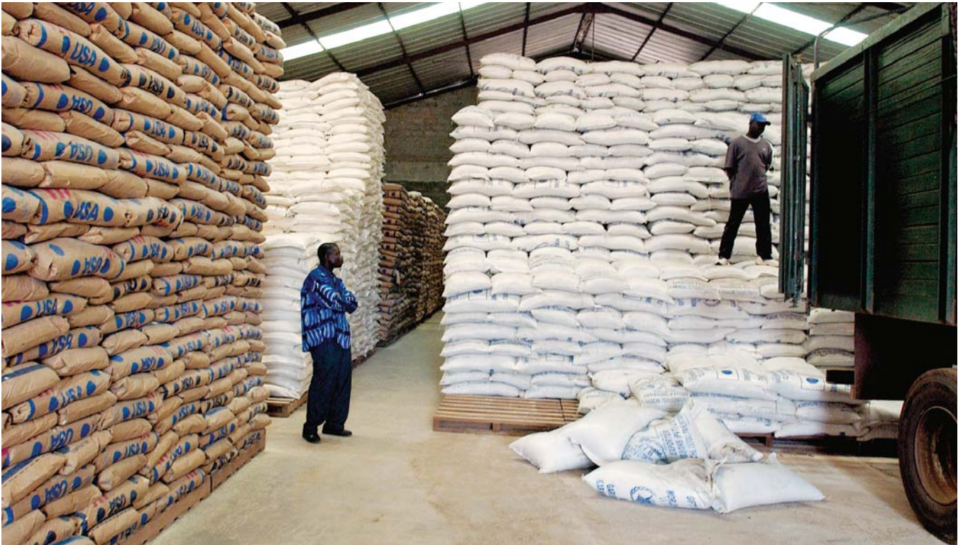
Getreideimporte können vielleicht kurzfristig Probleme der Knappheit lösen, untergraben aber die Fähigkeit der eigenen Landwirtschaft.