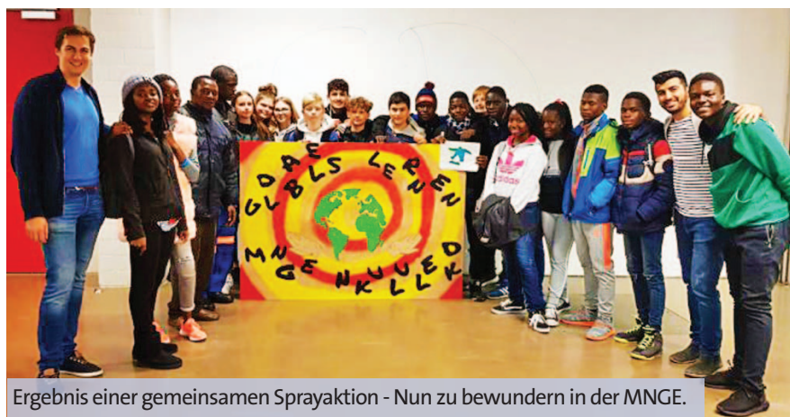
Ergebnis einer gemeinsamen Sprayaktion - Nun zu bewundern in der MNGE.

40 Jahre durchzuhalten gelingt nur, wenn man einen langen Atem hat. Man muss