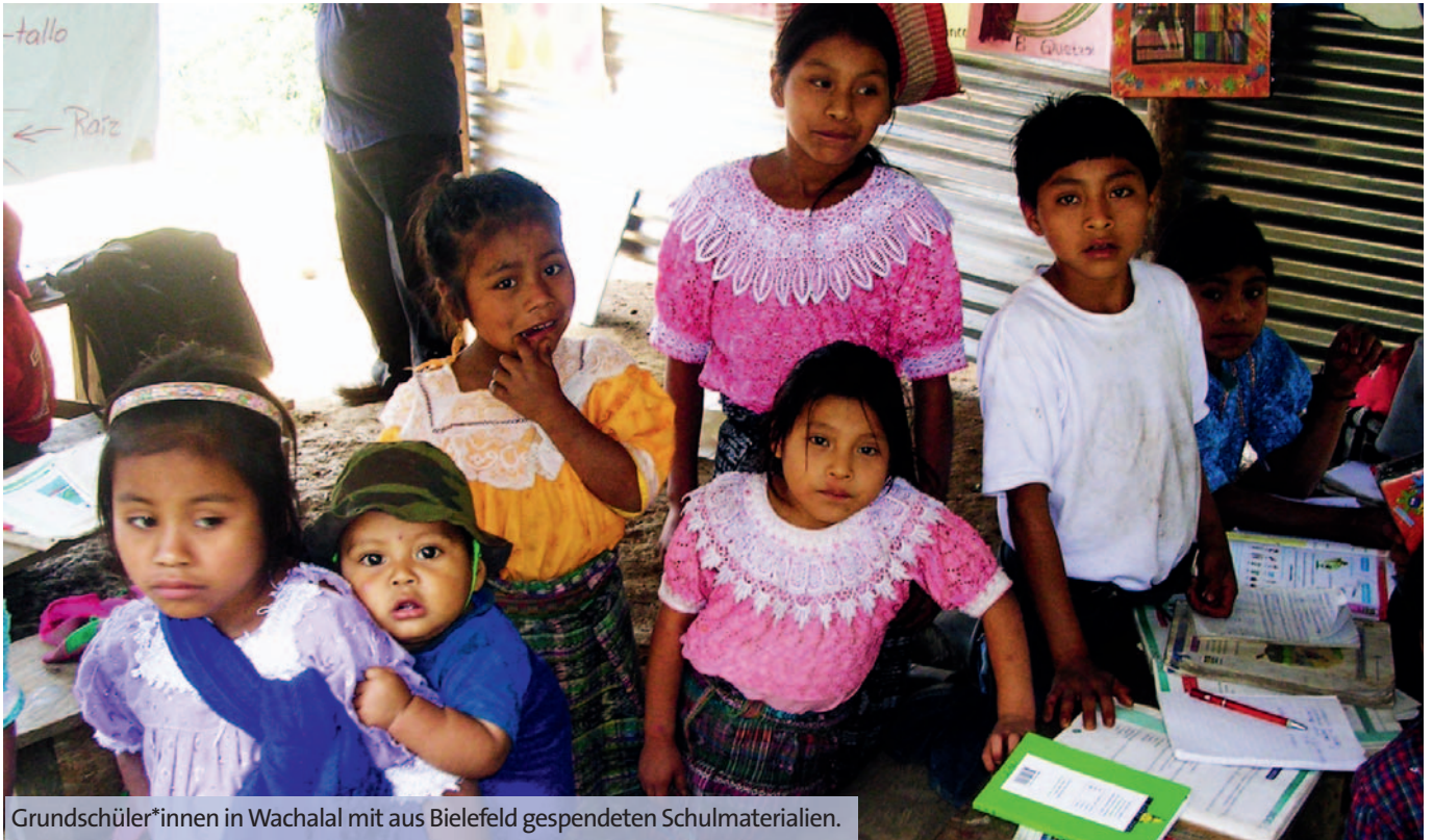
Grundschüler*innen in Wachalal mit aus Bielefeld gespendeten Schulmaterialien.