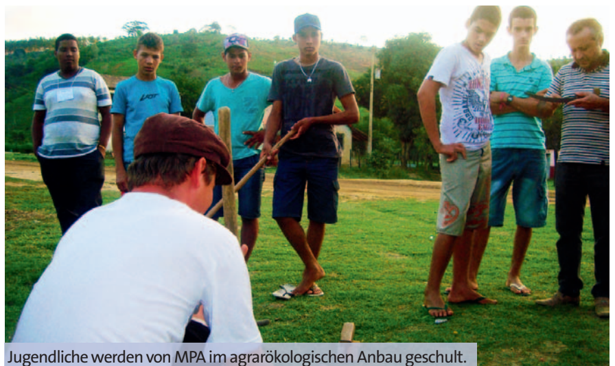
Jugendliche werden von MPA im agrarökologischen Anbau geschult.