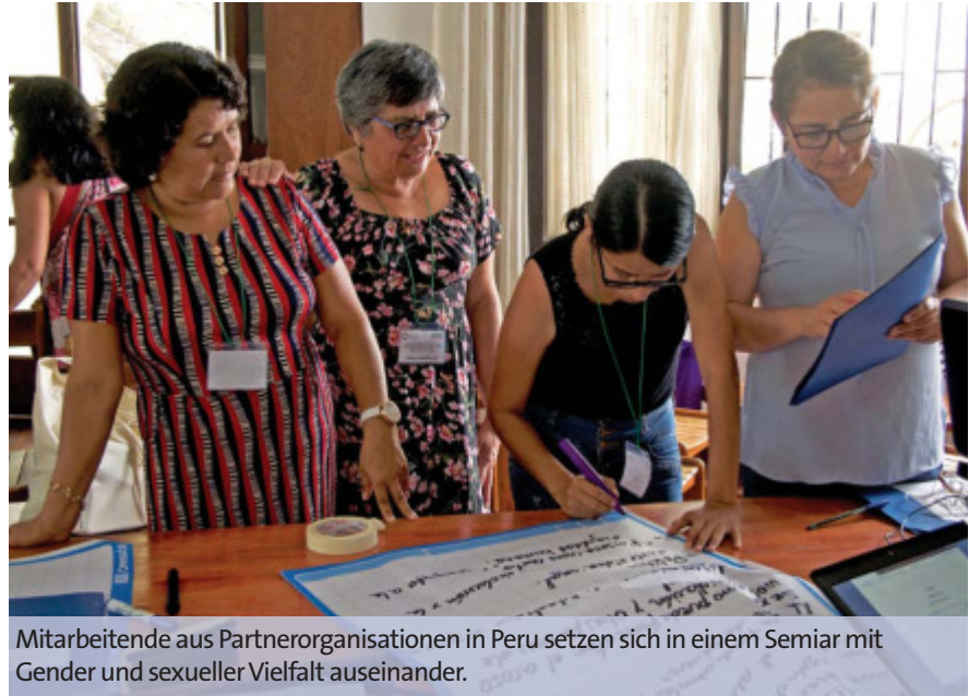
Mitarbeitende aus Partnerorganisationen in Peru setzen sich in einem Seminar mit Gender und sexueller Vielfalt auseinander.

Anfang 2020 kam es in Partnerworkshops in Mosambik, Ecuador, Peru und Südafrika zu einem entsprechenden Aus-