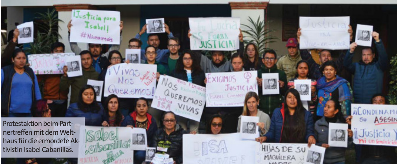
Protestaktion beim Partnertreffen mit dem Welt- haus für die ermordete Aktivistin Isabel Cabanillas.