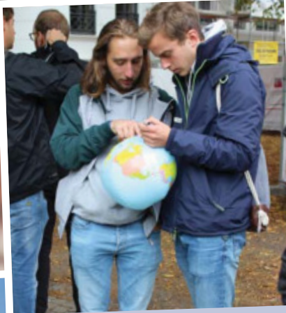
Workshop: Konsumkritischer Stadtrundgang