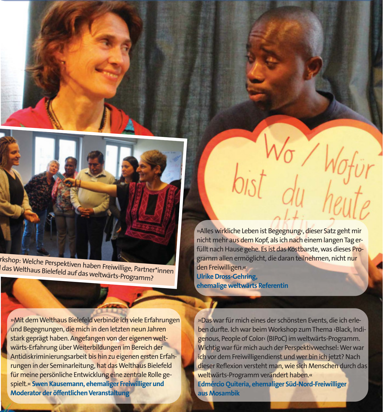
Workshop: Welche Perspektiven haben Freiwillige, Partner*innen und das Welthaus Bielefeld auf das weltwärts-Programm?

Am 07.09.2019 hat das Welthaus Bielefeld zu einer Tagung anlässlich 10 +1 Jahren weltwärts und 5 Jahren Süd-Nord Komponente eingeladen. Unter dem Motto »weltwärts wirkt weiter« diskutierten und feierten rund 400 Personen: gerade zurück gekehrte Freiwillige, Süd-Nord-Freiwillige, ehemalige Freiwillige, Gastfamilien, Vertreter*innen von Einsatzstellen und Personen aus dem Umfeld. In Workshops und Länderbegegnungsräumen sowie bei der öffentlichen Veranstaltung mit anschließender Party haben sich die verschiedenen Akteur*innen getroffen. Besonders glücklich sind wir, dass zu diesem Anlass auch sieben Vertreter*innen von Partnerorganisationen aus Ecuador, El Salvador, Mexiko, Mosambik, Nicaragua, Peru und Südafrika ihre Stimme einbrachten. Vor der Tagung trafen sie sich zu einem einwöchigen Austausch zu Themen der pädagogischen Begleitung von Freiwilligen.