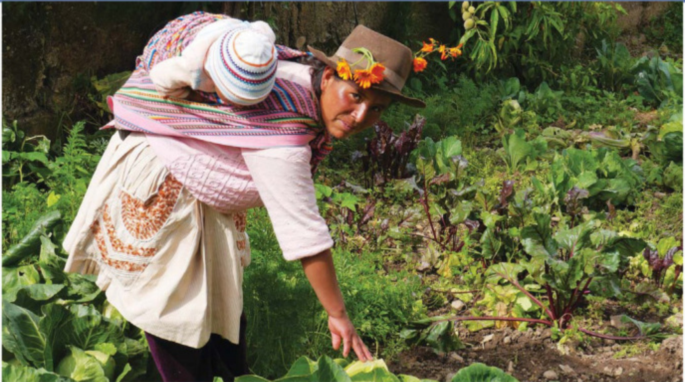
Die Ernährung der Quechua-Familien in Peru wird diversifiziert durch den Anbau von Gemüse.