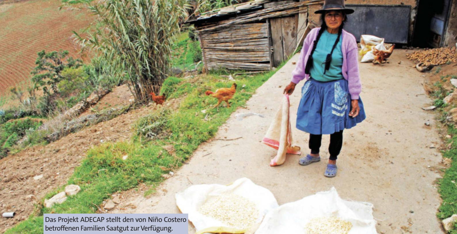
Das Projekt ADECAP stellt den von Niño Costero betroffenen Familien Saatgut zur Verfügung.