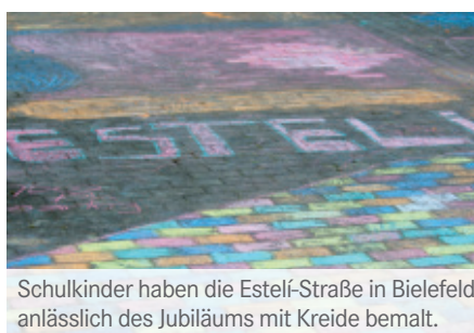
Schulkinder haben die Estelí-Straße in Bielefeld anlässlich des Jubiläums mit Kreide bemalt.