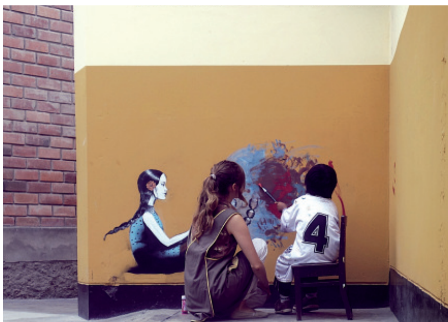
Zeit für künstlerische Aktivitäten an einer inklusiven Schule, die durch weltwärts ermöglicht wird. Projekt »Colegio Parroquial Nuestro Salvador ›Las Carmelitas«, Lima, Peru.

Es war ein bewegendes Treffen: Die erste Generation der Süd-Freiwilligen des Welthaus Bielefeld begrüßte in einer Jugendherberge nahe des Frankfurter Flughafens ihre NachfolgerInnen, bevor sie selbst nach ihrem weltwärts Jahr wieder in ihre Heimatländer zurück-