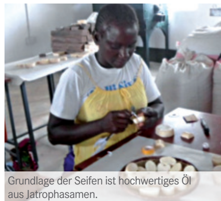
Grundlage der Seifen ist hochwertiges Öl aus Jatrophasamen.