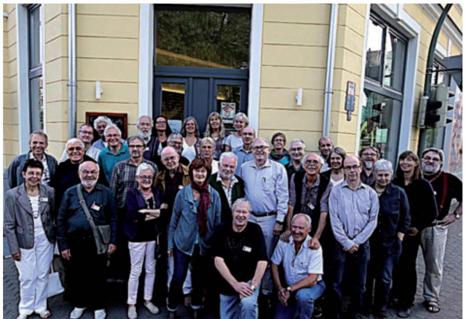
Nach 40 Jahren hat sich das Welthaus-Gründungsmitglied Aktionskomitee Afrika e.V., AKAFRIK, offiziell aufgelöst. Die Wiedersehensfreude war trotzdem groß und bot Anlass, sich zu alten und neuen Themen auszutauschen.

Für jedes steuerrechtlich eingetragene Kind wurde eine Zulage von 104,46 Euro monatlich gezahlt. Die Entlohnung der Mitarbeitenden im Welthaus Bielefeld erfolgt im Rahmen eines Haustarifs, der von Mitarbeitenden und Vorstand gemeinsam verabschiedet wurde. Der Rahmenvertrag sieht drei Gehaltsgruppen sowie eine Lohngruppe für Auszubildende vor, die sich an der Ausbildungsvergütung für Bürokaufleute orientiert.