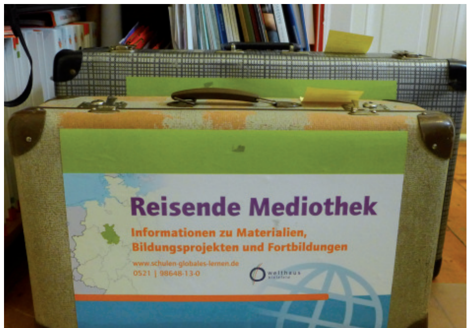
Neu erprobt wurde das Angebot der Reisenden Mediothek. Angepasst an die jeweilige Schulform werden verschiedene Materialien für den Unterricht zur Verfügung gestellt.

Café Welthaus entwickelt: Genussvolle Informationsabende zu den Klassikern des Fairen Handels wie Kaffee und Schokolade, stimmungsvolle Konzerte und engagierter Poetry Slam erreichen neue Zielgruppen und machen allen Beteiligten großen Spaß.