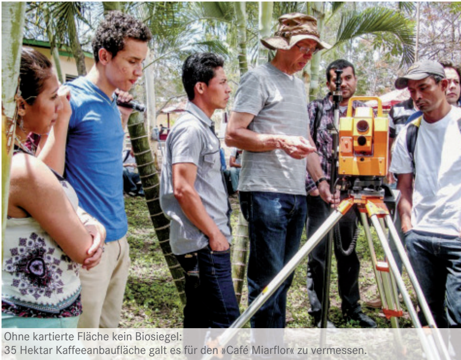
Ohne kartierte Fläche kein Biosiegel: 35 Hektar Kaffeeanbaufläche galt es für den »Café Miarflor« zu vermessen.

Wir schaffen Verbindung. Seit 1986 gibt es gute Kontakte zwischen Bielefeld und der Stadt Estelí im Nordwesten Nicaraguas, die 1995 in eine offizielle Städtepartnerschaft mündeten. Die Verzahnung von persönlichen Kontakten, institutionellen Partnerschaften und multinationalen Entwicklungsprojekten gilt bundesweit als vorbildlich.