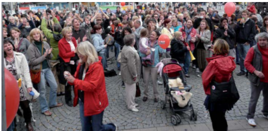
Menschen erheben sich gegen Armut auf dem Bielefelder Jahnplatz.

Mehr Informationen zur Kampagne: www.die-welt-braucht-dich.de