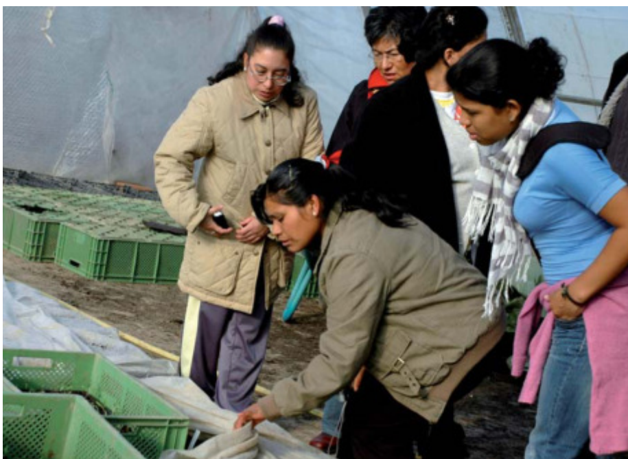
Ernährung gehört auch zum Thema Gesundheit: Die Gruppe der weltwärts-Partnerorganisationen besucht einen Bioland-Hof in der Nähe Bielefelds.

Das Projekt Geasphere in der südafrikanischen Provinz Mpumalanga informiert lokale Gemeinden über die ökologischen Auswirkungen der geplanten Ausweitung von Eukalyptus- und Kiefernplantagen. Der extrem hohe Wasserverbrauch und die Monokulturen auf dem ehemaligen Grasland nehmen den ansässigen Kleinbauern die Existenzgrundlage. Die Freiwilligen begleiten die Mitarbeiter von GeaSphere zu Arbeitstreffen mit lokalen und regionalen