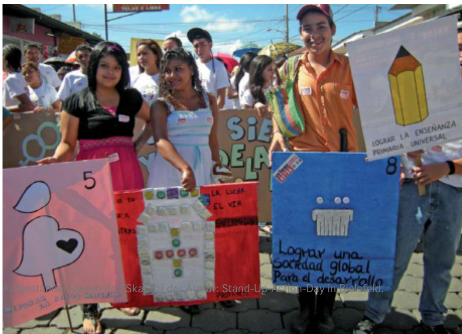
5.000 Menschen in Bielefelds Partnerstadt Estelí stehen auf für die MDGs.

Die Forderungen nach besserer und ausreichender Entwicklungsfinanzierung, einer kohärenten Entwicklungspolitik und einer konsequenten Ausrichtung der Entwicklungshilfe an den Zielen der Armutsbekämpfung sind zentrale politische Forderungen des Welthaus Bielefeld. Die Millenniumsentwicklungsziele (MDG) der Vereinten Nationen sind seit Mitte des letzten Jahrzehnts die Klammer für diese Forderungen und Referenzpunkt für vielfältige Aktivitäten.