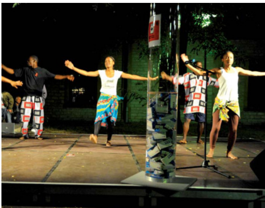
Die Lissaga Dance Company aus Berlin setzt die Millenniumsziele tänzerisch um.

Den musikalischen Wettbewerb »Create a women Song« in Kooperation mit dem Verein BAOBAB e.V. gewann die Band