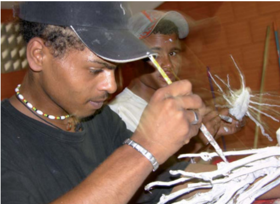
Kreativität und Handwerkskunst geben Selbstvertrauen und eröffnen neue Perspektiven in Brasilien.

Gelebte Partnerschaft braucht Bewegung – in den Köpfen und in den Füßen. Der intensive Austausch mit Projektpartnern ist seit jeher ein Qualitätsmerkmal unserer Entwicklungszusammenarbeit. Im Mittelpunkt stehen gegenseitige Besuche, vielfach getragen von Ehrenamtlichen. So entsteht Vertrauen und es kommt zu nachhaltiger, an den Bedürfnissen der Menschen des Südens orientierter Entwicklung. Drei Beispiele der langjährigen Solidaritätsarbeit mit Lateinamerika verdeutlichen dies.