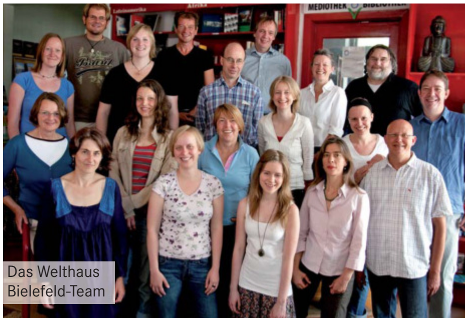
Das Welthaus Bielefeld-Team

Liebe Freundinnen und Freunde, liebe Leserinnen und Leser,