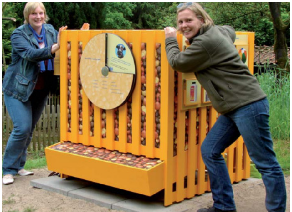
Sortenvielfalt erhalten: Die Kartoffelkiste des Welthaus Bielefeld zeigt warum.

Komplexe politische und wirtschaftliche Zusammenhänge zu veranschaulichen und lokale mit globalen Bezügen zu verknüpfen, dies ist das Ziel des »Weltgarten«. Die interaktive Wanderausstellung vermittelt Themen der Globalisierung für alle Sinne. Schwerpunkte sind die Themen Fairer Handel, Wasser, Biodiversität, globale Finanzmärkte und Computer. Passend zum UN-Jahr der Biodiversität entwickelte das Welthaus eine rundum erlebbare Kartoffelkiste. Hier können BesucherInnen beispielsweise erfahren, wo die meisten der weltweit über 5.000 Kartoffelsorten angebaut werden.