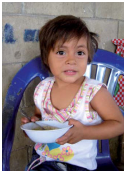
Gelungener Start ins Leben: Mädchen in Guarjila.

die die Menschen bedrohen, wie der geplante Bau einer Schnellstraße für Container-LKWs mitten durch das Dorf.