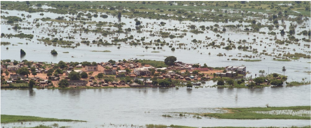
Überschwemmung in Mosambik.

Wir alle leben in der „Einen Welt“ und mit der „Einen Umwelt“ – und dennoch stellen sich die ökologischen Probleme für die Menschen in den armen Ländern meistens anders dar als in den Wohlstandsgesellschaften.