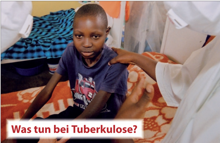
Was tun bei Tuberkulose?